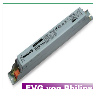
EVG von Philips